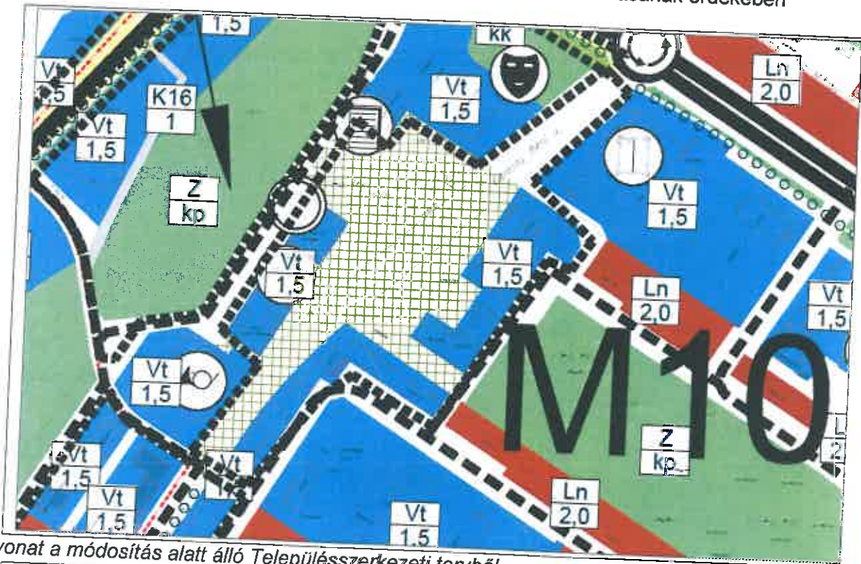
Kivonat a módosítás alatt álló Településszerkezeti tervből