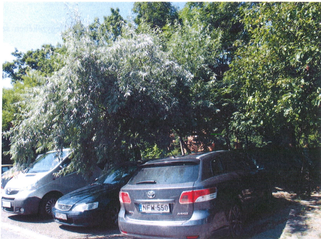
2.sz fénykép. Megdőlt, statikailag is problémás ezüstfa a Turbán utcában