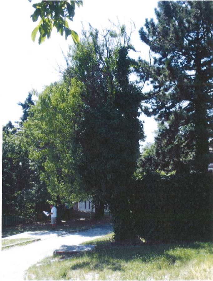
1.sz fénykép. Leromlott állapotú mandula fa a Turbán utcában