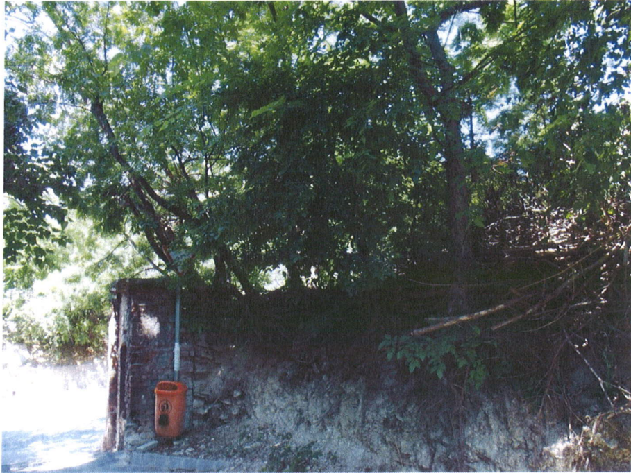
3.sz fénykép. Celtis fák az Apostol utcában, a föld-fal tetején, kockáztatva annak leomlását

Az Apostol utca kivezető szakaszán több gyomosító özönnövény ( Celtis occidentalis ) faegyed található, melyek kivágása kifejezetten ajánlott, viszont a támfalszerűen álló, épített segédmű nélkül a meredek partfalat rögzítő fák jelenléte fontos ( 3.sz. fénykép ). Ezen a helyen épített támfal és azonnali fapótlás szükséges az utca használhatóságának érdekében.