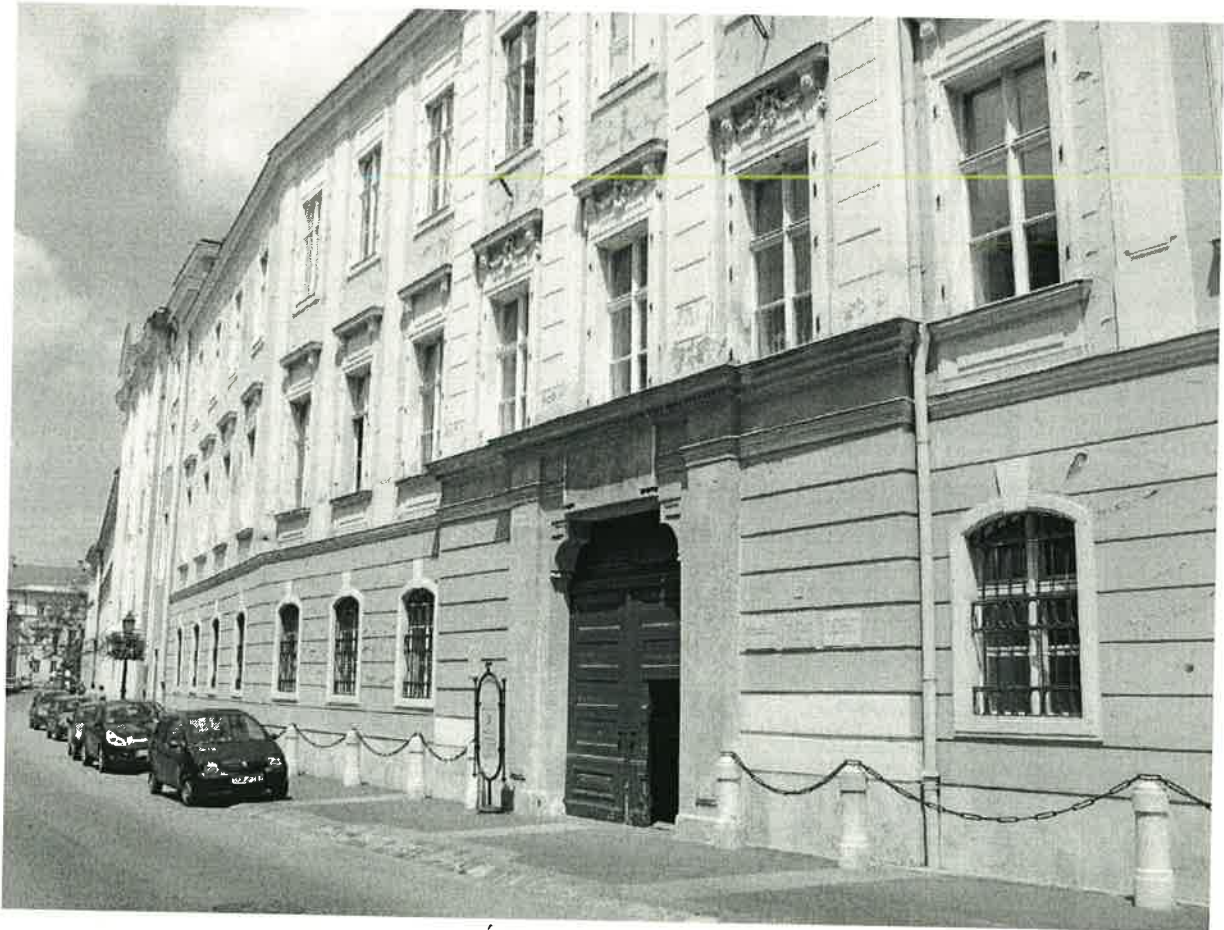
Úri utcai homlokzat