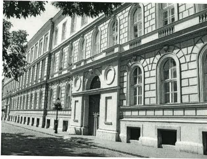
Országház utcai homlokzat