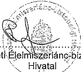
Nemzeti Élelmiszerlánc-biztonsági Hivatal Palyóka Mihály-igazgató helyettes Megrendelő

Kelt: Budapesten, 2013. május hó 13. napján