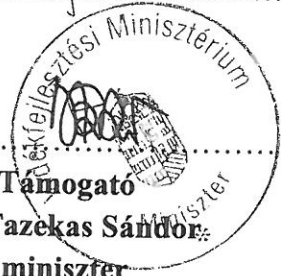
Támogató Dr. Fazekas Sándor miniszter

Kelt, Hódmezővásárhely, 2014. március 11.