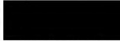
Bíráló Bizottság tagja