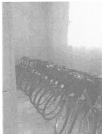
(20 db Csepel kerékpár)

Hajdúdorog város közigazgatásilag elég nagy területen fekszik, sok a földút és elég messze elnyúlnak. A munka hatékonyabb végzéséhez, hogy a munkavállalók időben megérkezzenek a munkaterületre, 20 db kerékpárt vásároltunk június 17-én.