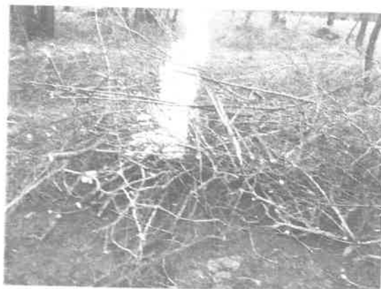
(Gally égetése: Iskola dűlő 0262 hrsz.)