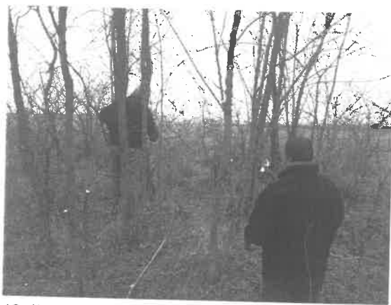
(Gally vágás kézi szerszámmal Iskola dűlő 0262 hrsz.)