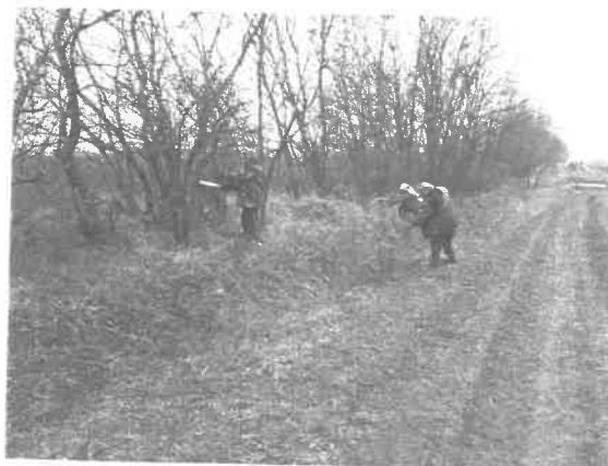
(Fehér dűlő: 0124/2 hrsz faritkítás)