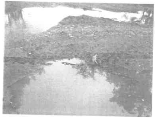
Disznókút K: 0207/3 hrsz. víz leengedése

2013. március 14-én rendkívüli időjárásra tekintettel 7 fő dolgozott a Disznókút K: 0207/3 helyrajzszámú 2,3 km hosszúságú dűlőúton, ahol a vizet engedték le kézi szerszámmal (ásó, kapa, csákány).