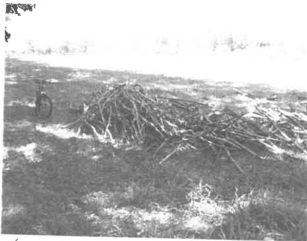
(Hajdúdorogi Strandfürdő komposztáló területe)

Dűlő utak melletti fasorok ritkítását, cserjéltelenítést kézi szerszámmal, majd később a megvásárolt szerszámokkal a parlagfűirtást (Korona dűlő: 0136 hrsz., Közlekedő dűlő: 088 hrsz., Kabát dűlő: 0142/1 hrsz., Fehér dűlő: 0255 hrsz., Iskola dűlő: 0262 hrsz., Veres dűlő: 0305 hrsz. 0302 hrsz., Határ dűlő: 078 hrsz., Csárda dűlő: 068 hrsz. 083 hrsz. 091 hrsz., 064 hrsz. 086 hrsz. 089 hrsz.) kezdtük el. Ez összesen: 14,116 km.