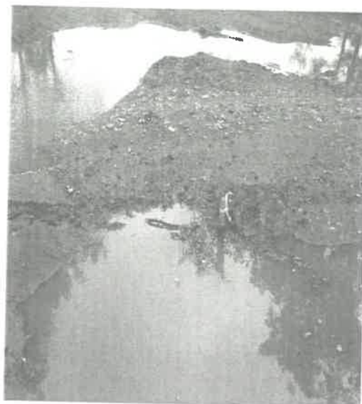
Disznókút K: 0207/3 hrsz. víz leengedése

2013. március 14-én rendkívüli időjárásra tekintettel 7 fő dolgozott a Disznókút K: 0207/3 helyrajzszámú 2,3 km hosszúságú dűlőúton, ahol a vizet engedték le kézi szerszámmal (ásó, kapa, csákány).