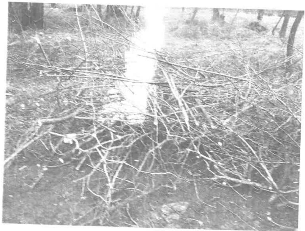
(Gally égetése: Iskola dűlő 0262 hrsz)