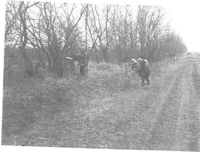
(Fehér dűlő: 0124/2 hrsz faritkítás)