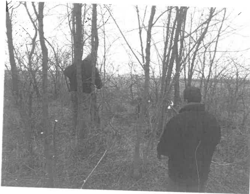
(Gally vágás kézi szerszámmal Iskola dűlő 0262 hrsz )