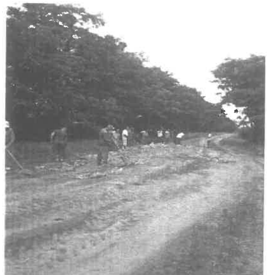
Fehér dűlő: 0255 hrsz.

Továbbá árokpartok igazítása, árkok tisztítása kézi szerszámmal. Dűlő utak kiegyengetése, kátyúk feltöltése törmelékkel. (Fehér dűlő: 0255 hrsz. – 1,3 km)