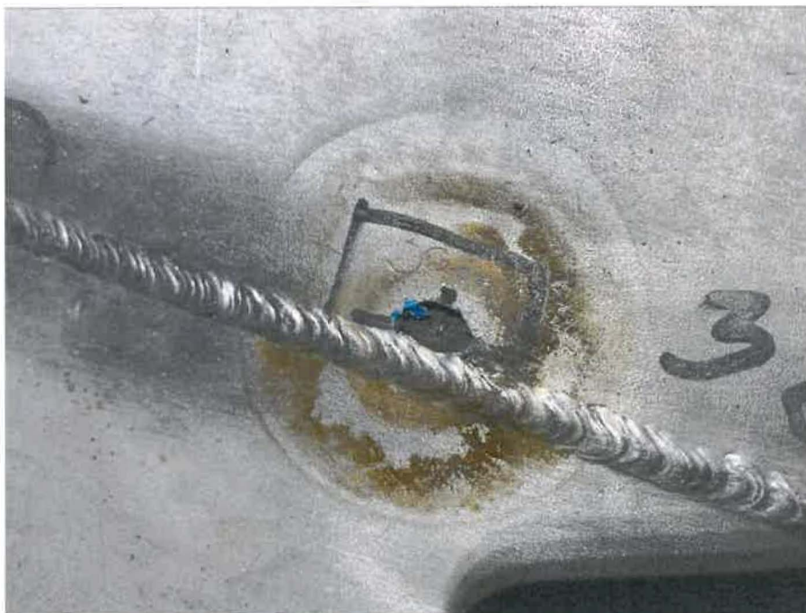
Lyukadás a fenék hosszvarrat mellett