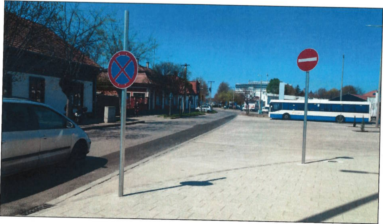
12. számú fényképfelvétel