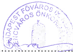
Baranyi Krisztina polgármester Budapest Főváros IX: kerület Ferencváros Önkormányzata Megbízó