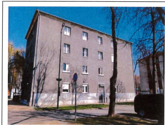
3700 Kazincbarcika Munkácsy tér 3. 2/9