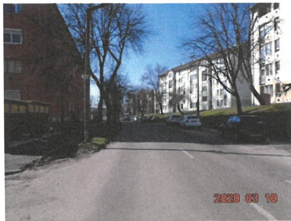
3700 Kazincbarcika, Május 1.út 20.2/8. hrsz.: 1138/4/A/8