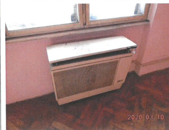
Konvektor a szobában