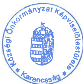
Tóth Tihamér polgármester